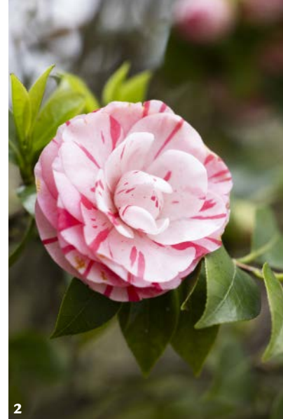
1. Veduta aerea dei giardini nell'area intorno alla villa e all'aranciera. 2. Camellia japonica 'Bonomiana'. 3. La lunga passeggiata che fiancheggia il lago è ombreggiata dai platani potati bassi.