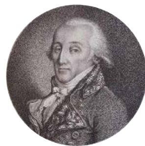
Francesco Melzi d'Eril, in un ritratto di inizio Ottocento

Carlotta. Anche per progettare il giardino Francesco Melzi d'Eril si affidò a professionisti rilevanti nel panorama del primo Ottocento, incaricando Luigi Villosi (1779-1823), stimato botanico e Luigi Canonica (1762-1844), architetto ufficiale della Milano napoleonica, che lavorò anche per una rinomata committenza privata. I due, che si erano conosciuti a Monza, dove collaborarono alla sistemazione del Parco della Villa Reale, nel 1811, diedero al giardino di Villa Melzi d'Eril la conformazione che ancora oggi possiamo apprezzare. In soli 5 giorni, con l'aiuto di 50 uomini, sbancarono la collina a picco sul lago per ottenere l'ampia fascia pianeggiante a ridosso della riva, che gradualmente sfuma in un susseguirsi di dolci e irregolari ondulazioni del terreno, dove dossi e collinette più o meno ripide, vestite da una vegetazione di alberi e arbusti ben calibrata, daranno vita, nei tre decenni successivi, a uno dei primi esempi di →